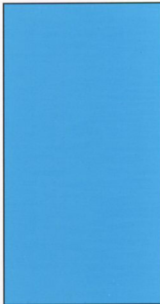
72 - AZUL INTENSO